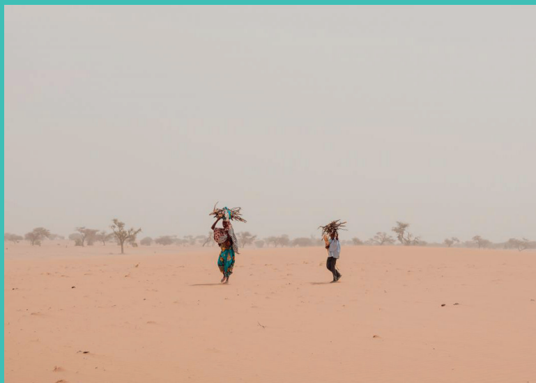
La désertification en Afrique, un enjeu majeur pour les systèmes de santé.