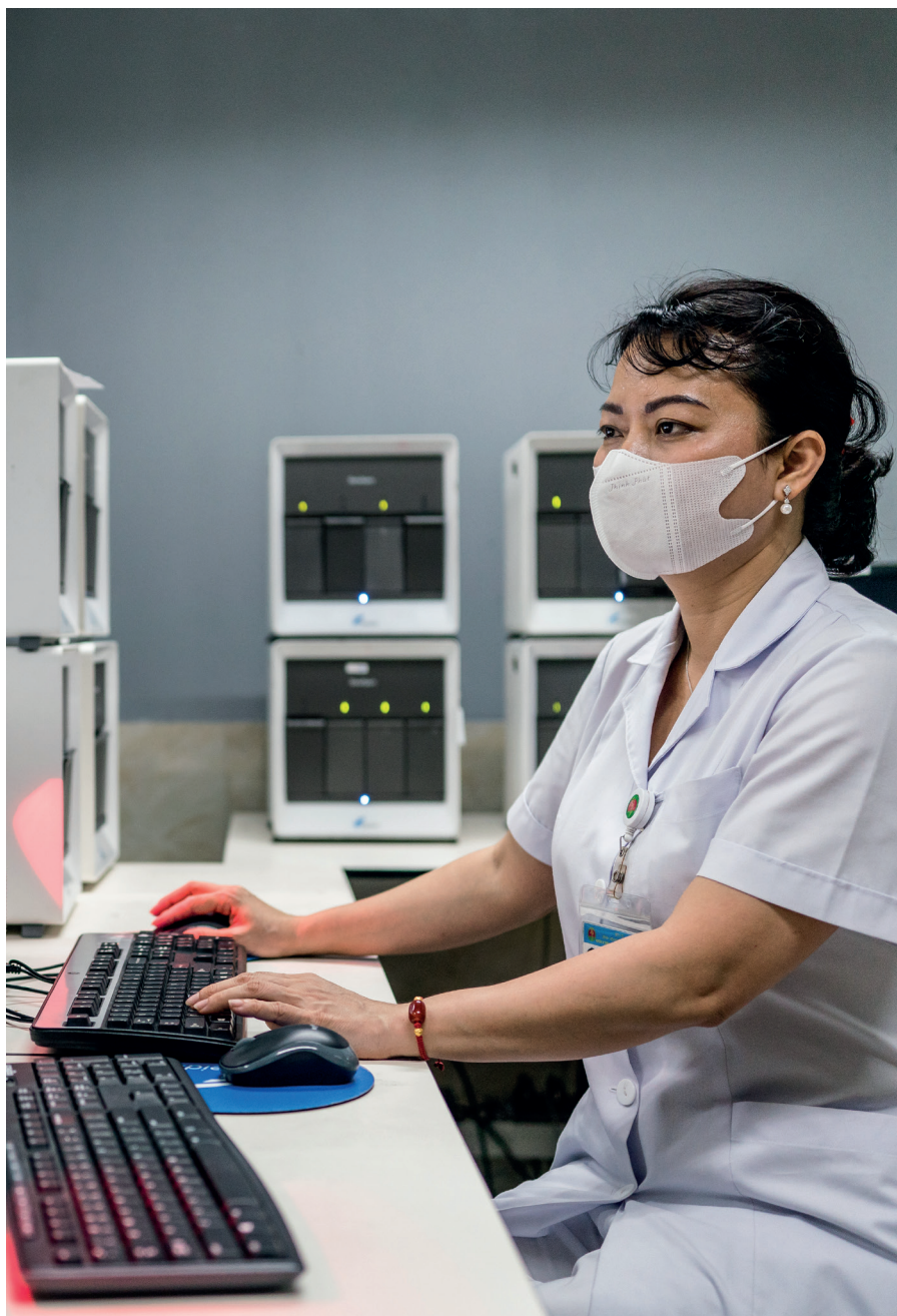
Laboratoire de microbiologie et centre de référence pour la tuberculose au National Lung Hospital à Hanoi, Vietnam.