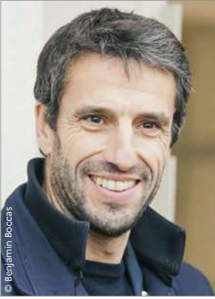
Tony Estanguet Président de Paris 2024