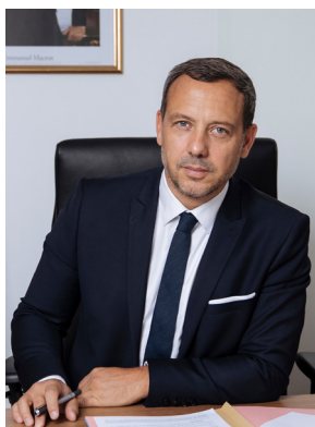
Adrien Taquet, secrétaire d'État en charge de l'enfance et des familles

En moins d'un quart de siècle, les technologies numériques se sont imposées dans un grand nombre de nos activités et ceci à tous les âges de la vie. Les enfants de 2 ans sont 84 % à regarder la télévision au moins une fois par semaine. Entre 3 et 17 ans, la moyenne de temps passé devant les écrans est de 3 heures par jour en France 1 . À cet égard, la crise de la Covid-19 et les confinements successifs que nous avons connus n'ont, une fois de plus, pas épargné nos enfants. Le phénomène d'exposition croissante aux écrans est bien réel, et il doit nous alerter.